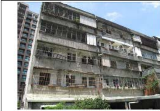
建物外觀窳陋破敗