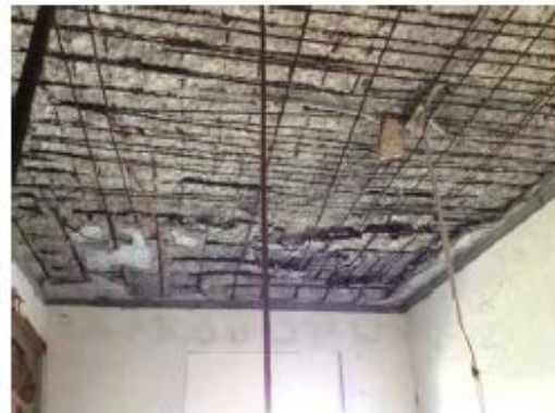
建物內部樓板鋼筋外露疑似海砂屋