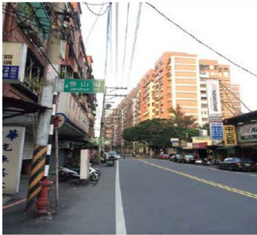
光峰路金山街交叉口