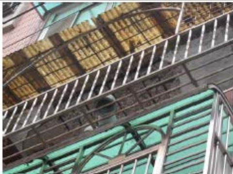
建物外部陽台樓板鋼筋外露