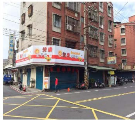
光峰路、育英街交叉口