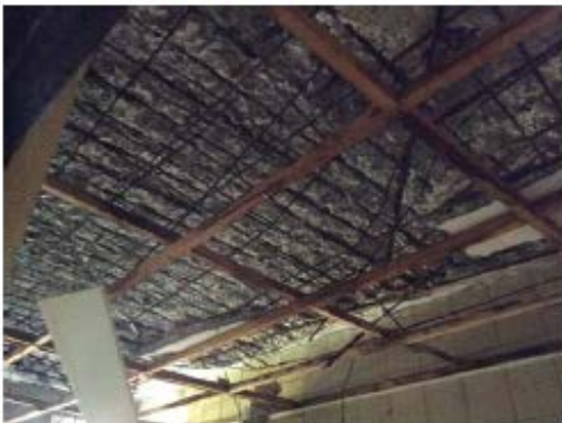
建物內部樓板鋼筋外露疑似海砂屋