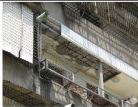
建物外部樓板鋼筋外露